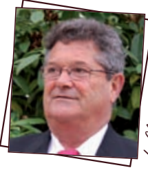
Le Clos Triand