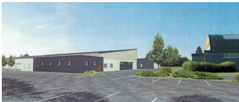
Perspective de la nouvelle salle.

Elle devrait accueillir en septembre 2009, boxe anglaise, cirque, danse, gymnastique enfants et adultes, tir à l'arc, musculation... Les activités qui se déroulent déjà sur ce site continueront d'y être pratiquées: handball, patinage sur roulettes, rink hockey, rugby.