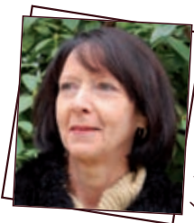
Les bas Villat