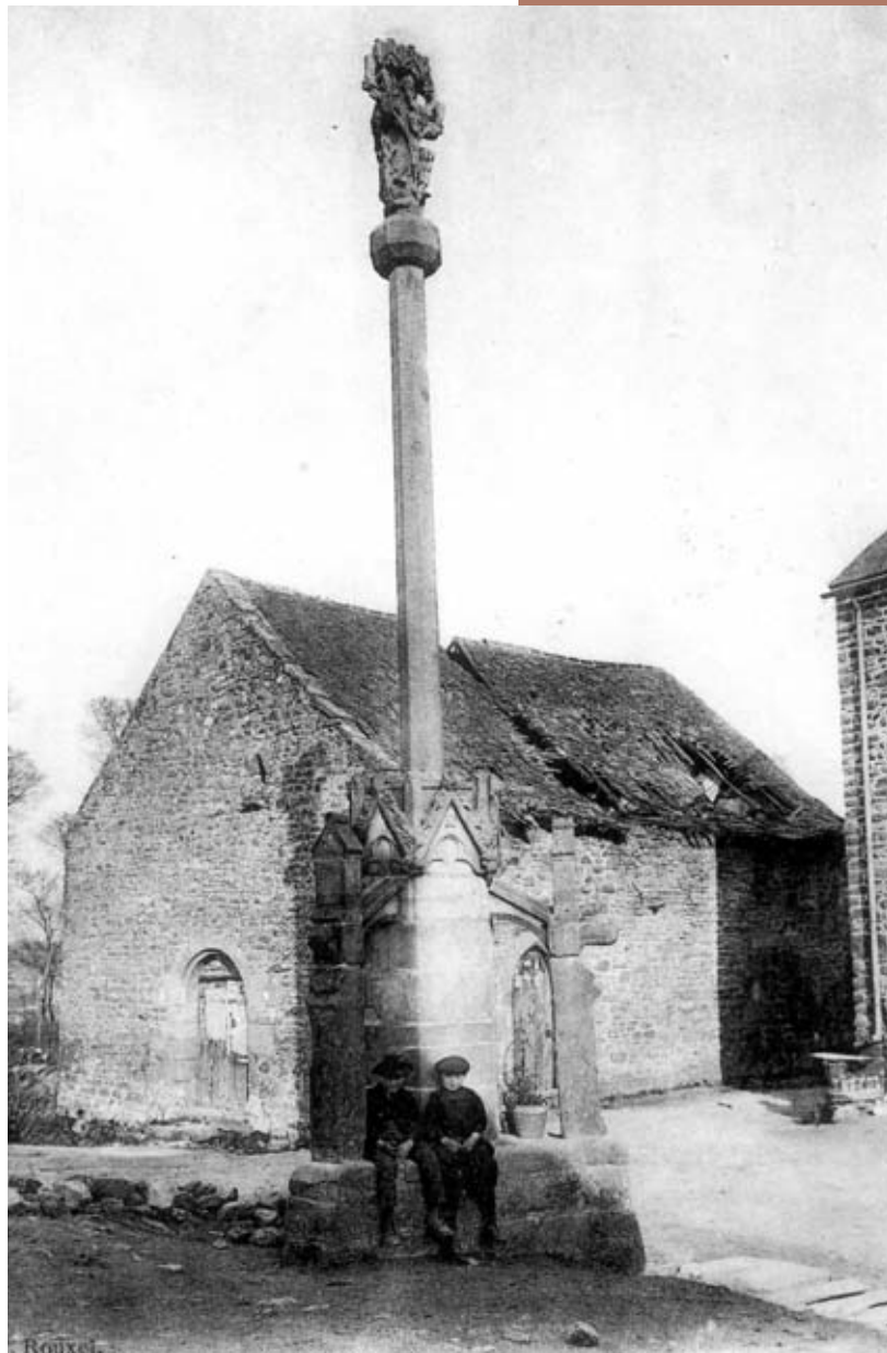
Le carrefour du Saint Esprit, tel qu'on pouvait le voir à la fin du XIX e siècle.