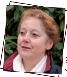
Le Clos Gastel