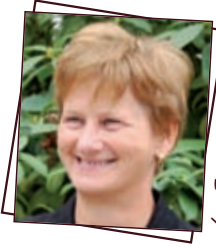
Les Jardins de l'Échappé