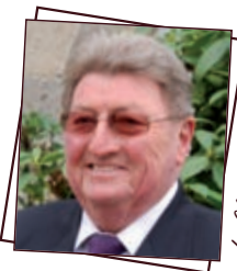
Le Clos Gastel

■ Conseiller Municipal ■ Conseiller Communautaire CODI