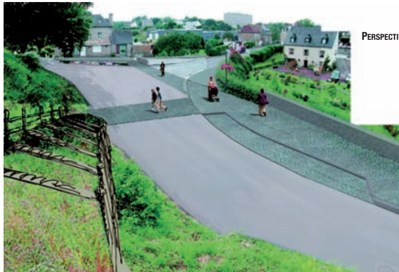
PERSPECTIVE AMÉNAGEMENT ENTRÉE DE BOURG