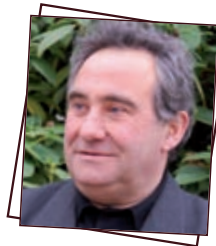
La Vallée des Granges