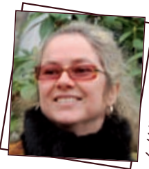
La Ville es Dizeaux