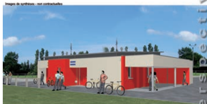
Images de synthèse - non contractuelles